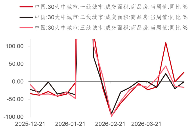
图 3：近期一、二、三线城市商品房周成交同比回升