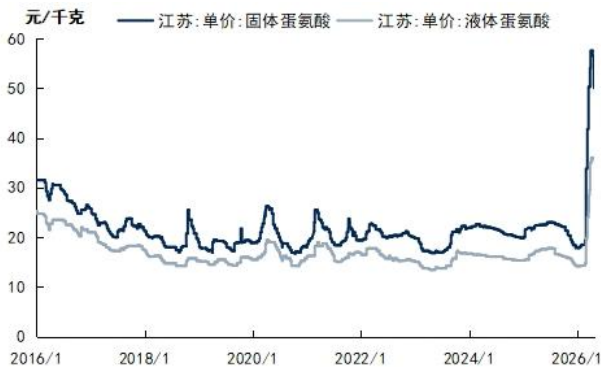
图3：蛋氨酸市场价格走势

蛋氨酸量价齐升，盈利大幅增长。 随着2025年公司7万吨/年固体蛋氨酸技改项目及18万吨/年液体蛋氨酸（折纯）项目建成投产，目前公司蛋氨酸产能已达55万吨/年（权益产能46万吨/年），产能规模跃居全球第三。美伊战争于2026年2月28日正式爆发，导致蛋氨酸原材料成本抬升，同时部分海外产能阶段性停产产生供需缺口，3月以来蛋氨酸价格大幅上涨，据博亚和讯，4月27日国内固体蛋氨酸价格为44元/千克，较年初上涨26.4元/千克，涨幅达150%，而新和成蛋氨酸产能维持正常开工，同时新产能持续爬坡，预计2026年产销量将实现增长。2025年公司子公司山东新和成氨基酸有限公司实现营收76.56亿元，同比增长18.08%，净利润达29.72亿元，同比增长31.10%，净利润率38.82%，同比提升3.85pcts，新和成的蛋氨酸成本优势显著。我们看好新和成在2026年将充分享受蛋氨酸量价齐升带来的利润增厚。