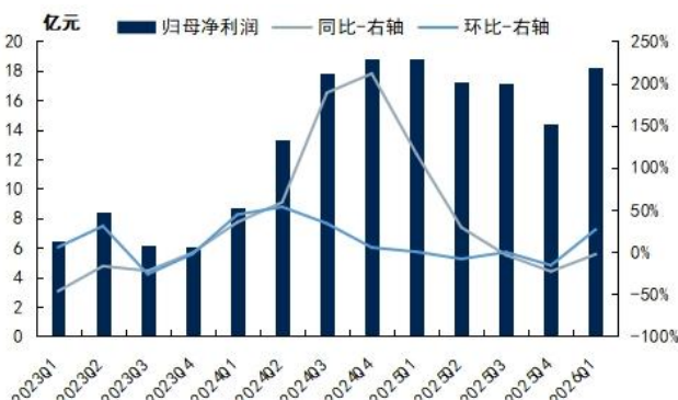
图2：新和成季度归母净利润及同比增速