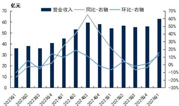
图1：新和成季度营业收入及同比增速

一季度营收及归母净利润均实现环比增长。2026年第一季度，新和成实现营业收入62.95亿元，同比增长15.72%，环比增长12.22%，归母净利润为18.27亿元，同比小幅下降2.80%，环比增长26.59%；销售毛利率为42.88%，同比下降3.82pcts，环比提升0.80pcts；销售净利率为29.16%，同比下降5.54pcts，环比提升3.35pcts。考虑1、2月份公司主营产品维生素E、蛋氨酸市场价格同比去年下跌，3月份蛋氨酸价格同比去年上涨，公司部分产品销量增加，进而实现营收同环比增长，归母净利润同比小幅下降但环比增长，保持了稳健的经营水平。