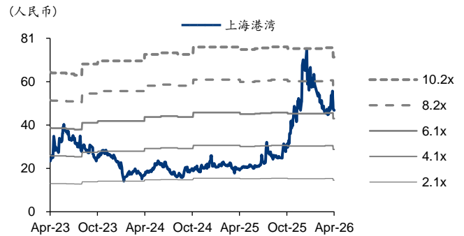
图表4: 上海港湾 PB-Bands