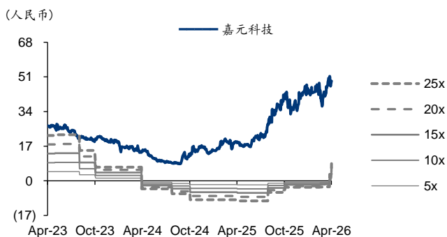
图表2: 嘉元科技 PE-Bands

注: 数据截至 2026 年 4 月 28 日收盘价。 资料来源: Bloomberg、iFind、华泰研究