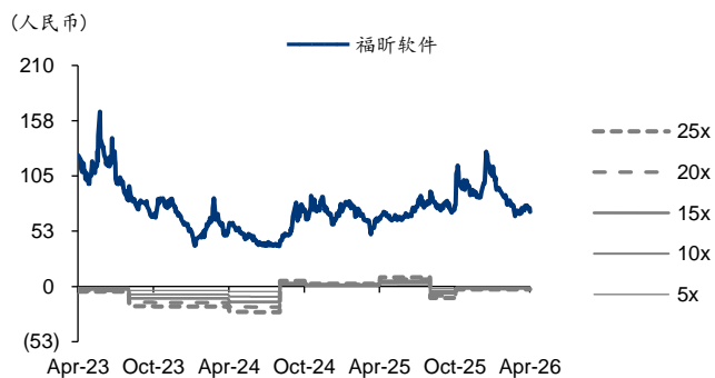
图表3: 福昕软件 PE-Bands

联营企业业绩波动风险。 若公司的联营企业业绩波动，可能导致公司确认投资损失，从而对利润产生一定影响。