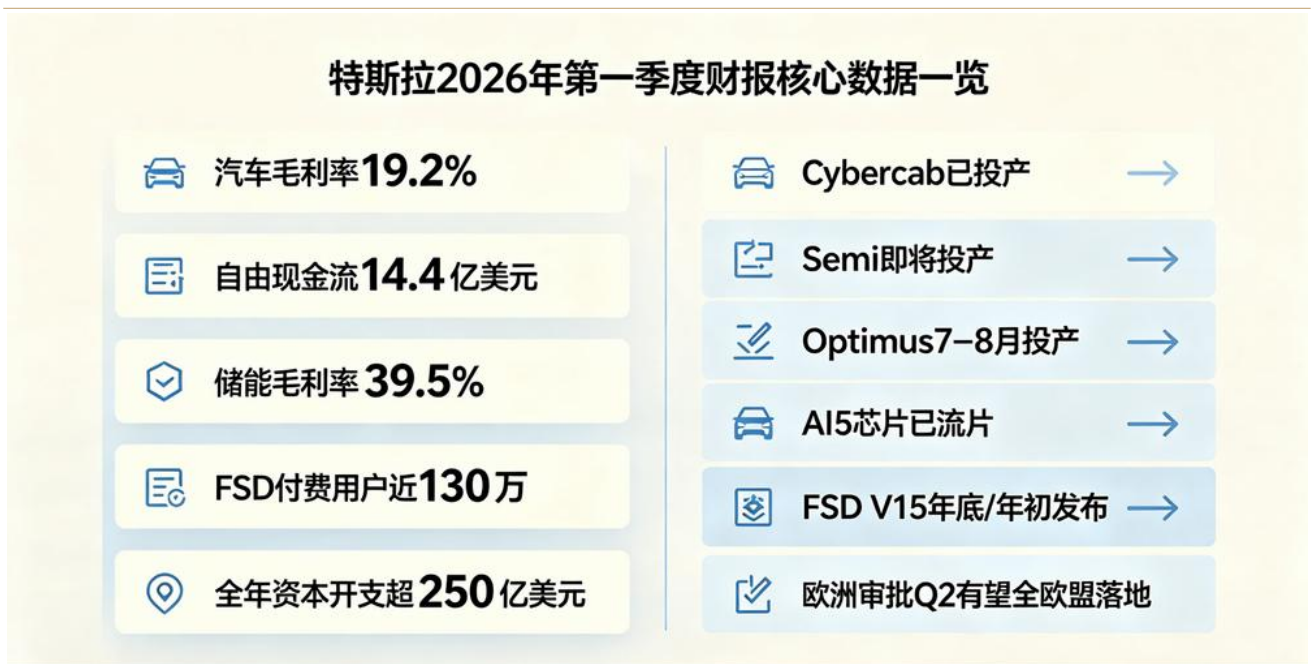
图表 4: 特斯拉 2026Q1 财报宣布 Optimus7-8 月投产

第二阶段落地德州超级工厂，定位为更大规模的二代专用产能。公司正在为 Gigafactory Texas 准备第二代 Optimus 产线，该产线按长期年产能 1000 万台进行设计；财报中，制造与硬件产能表也将 Texas Optimus 列为 Construction 状态，说明德州端已进入厂房及配套基础设施建设/工具安装阶段。与弗里蒙特“改造既有 Model S/X 产线”不同，德州更偏向新建专用产线和长期主力产能平台，预计 2027 年夏季投产。