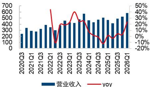
图1：公司营收（百万元）及 yoy

千味央厨 2025 年实现营业总收入 18.99 亿元，同比增长 1.64%；实现归母净利润 0.64 亿元，同比减少 24.04%；实现扣非归母净利润 0.62 亿元，同比减少 24.62%。2026Q1 公司实现营业总收入 5.83 亿元，同比增长 23.83%；实现归母净利润 0.23 亿元，同比增长 5.40%；扣非后归母净利润 0.21 亿元，同比增长 1.00%。