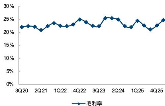
图3：公司毛利率变化情况

大客户定制能力凸显，积极布局新增长曲线。 渠道端公司在稳固百胜、海底捞等大客户基本盘的同时，大力开拓新零售渠道。海外布局稳步推进，泰国等地已供应头部连锁餐饮，马来西亚工厂预计于 2026 年 7 月前后投产，有望打开东南亚市场空间。