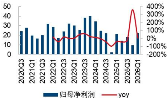
图2：公司归母净利润（百万元）及 yoy