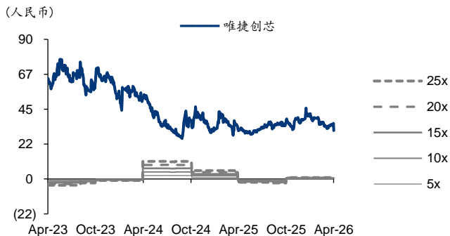
图表3: 唯捷创芯 PE-Bands