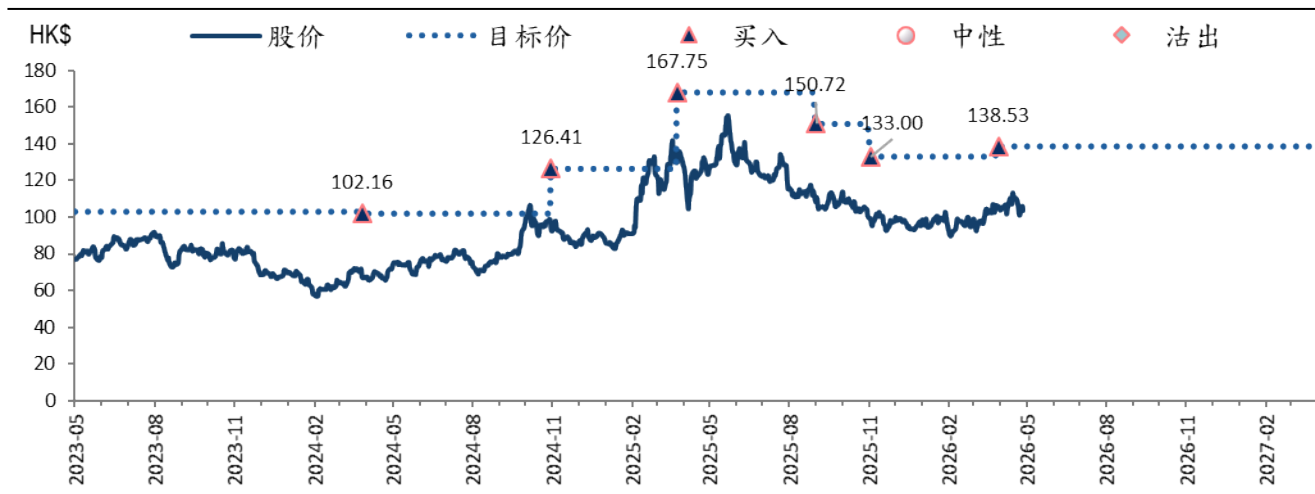
图表 1：比亚迪股份 (1211 HK) 评级及目标价