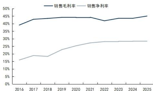
图3: 呈和科技销售毛利率和销售净利率