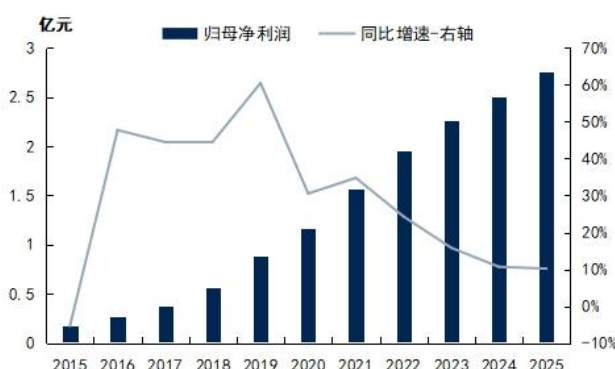
图2: 呈和科技归母净利润及同环比增速