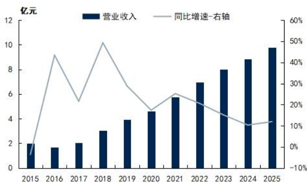
图1: 呈和科技营业收入及同环比增速

分业务看 ，2025 年呈和科技成核剂营业收入 5.96 亿元，同比增长 16.58%，毛利率 55.64%，同比减少 0.27 pct，其中成核剂销量 11614.42 吨，同比增长 19.40%，销售均价 5.13 万元/吨，同比降低 2.36%，公司以复合助剂形式销售的成核剂占比提升，使得成核剂销量增长而销售均价下降；合成水滑石营业收入 1.26 亿元，同比增长 7.97%，毛利率 44.63%，同比减少 2.39 pct；NDO 复合助剂营业收入 0.60 亿元，同比增长 3.71%，毛利率 23.62%，同比减少 1.30 pct；抗氧剂营业收入 1.14 亿元，同比增长 61.36%，毛利率 11.60%，同比减少 3.33 pct；贸易业务营业收入 0.81 亿元，同比下降 29.58%，毛利率 30.23%，同比增加 23.09 pct。