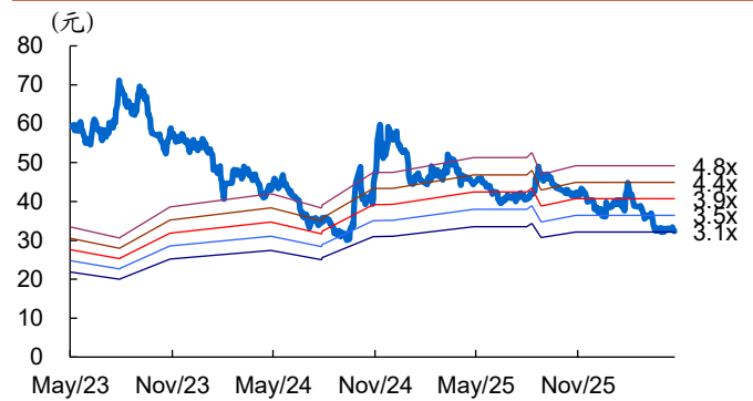
图 2: 水井坊历史 PB Band