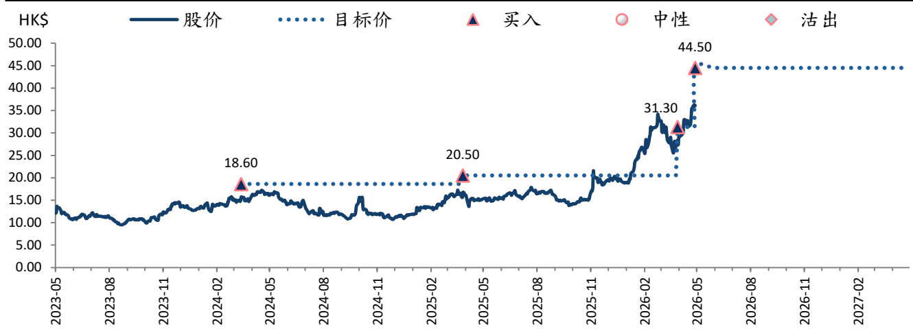
图表 1: 潍柴动力 (2338 HK) 评级及目标价