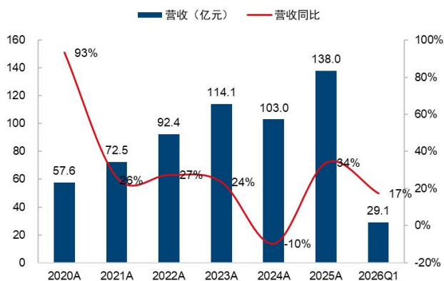
图1：联影医疗营业收入及增速（单位：亿元、%）

2025 年业绩高增长，高端化与全球化双轮驱动增长。 2025 年公司实现营收 138.00 亿元（+33.98%），归母净利润 18.69 亿元（+48.14%），扣非归母净利润 17.70 亿元（+75.18%），25Q4 单季营收 49.41 亿元（+47.69%），归母净利润 7.49 亿元（+26.81%），扣非归母净利润 7.17 亿元（+31.19%），2025 年业绩高增长主要受益于国内医疗设备更新政策推动招投标复苏、高端产品市场认可度提升及海外业务快速增长等多重因素。2026 年一季度公司实现营收 29.08 亿元（+17.34%），归母净利润 3.99 亿元（+7.78%），扣非归母净利润 3.72 亿元（-1.75%），实现稳健开局。