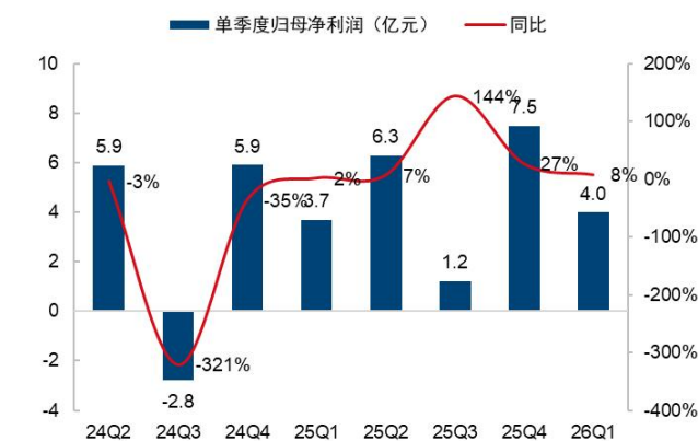
图4：联影医疗单季归母净利润及增速（单位：亿元、%）