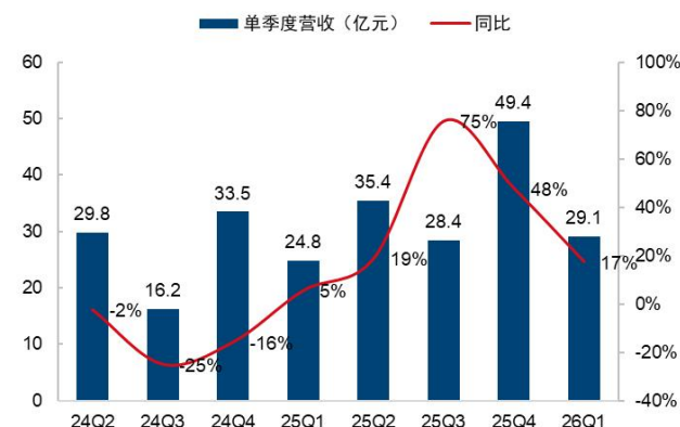
图2：联影医疗单季营业收入及增速（单位：亿元、%）