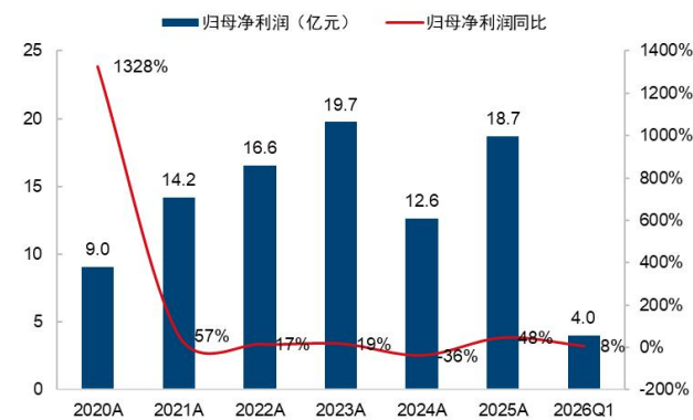
图3：联影医疗归母净利润及增速（单位：亿元、%）