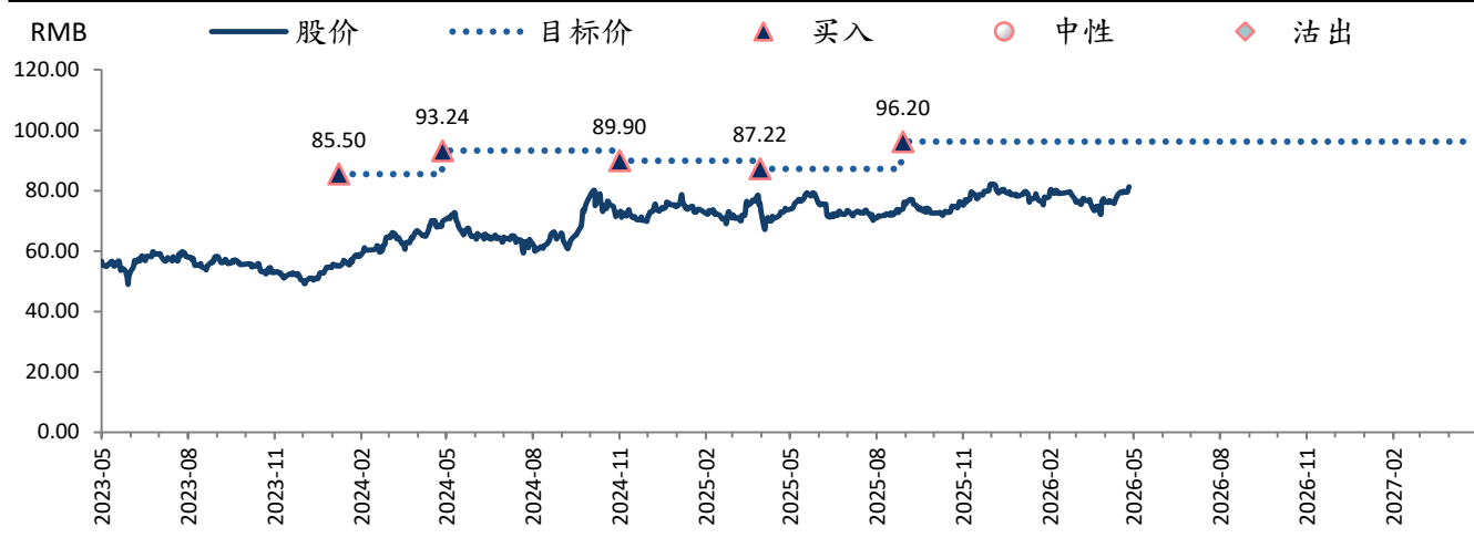
图表 1: 美的集团 (000333 CH) 评级及目标价