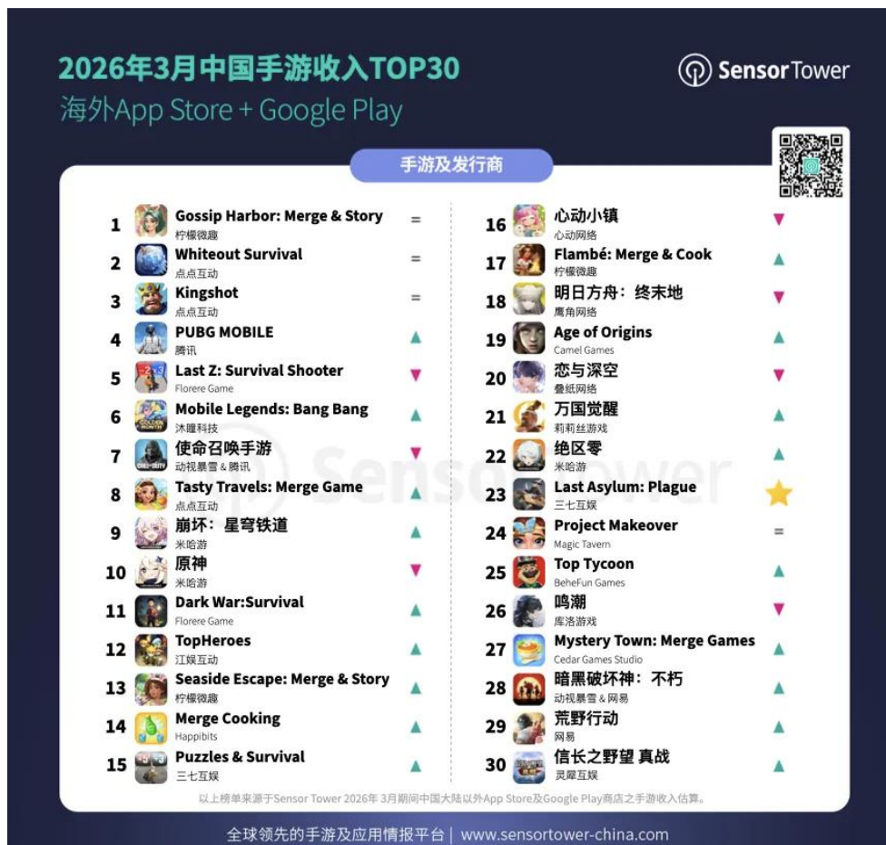
图3: 2026 年 3 月中国手游收入 TOP30|海外 AppStore+GooglePlay

根据 SensorTower 数据,2026 年 3 月中国手游收入前三名分别为柠檬微趣《Gossip Harbor: Merge&Story》、点点互动《Whiteout Survival》和点点互动《Kingshot》。