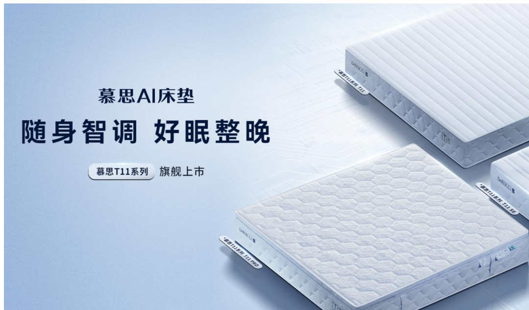
图 2:慕思 AI 床垫