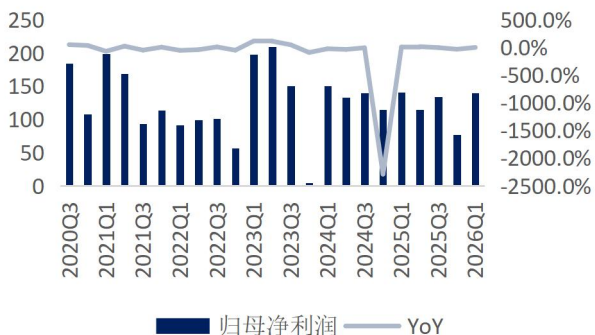
图3: 姚记科技归母净利润及增速（单位：百万元、%）