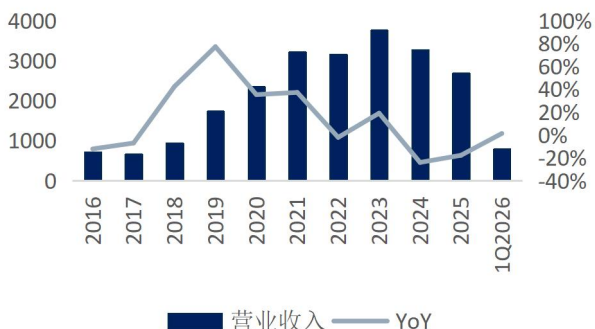
图1: 姚记科技营业收入及增速（单位：百万元、%）

2) 2026 年 Q1 公司实现营业收入 7.89 亿元，同比增长 1.31%；归母净利润 1.40 亿元，同比微降 0.64%，对应 EPS 0.33 元（2025Q1 为 0.34 元）。营收端平稳开局，利润端基本持平。毛利率 37.94%（2025Q1 为 44.29%），同比下降 6.35pct，主要因收入结构变化（低毛利的数字营销业务占比阶段性提升）。销售费用 3,225 万元（同比-48.42%），延续优化趋势；研发费用 3,221 万元（同比-18.57%），投入节奏有所放缓。