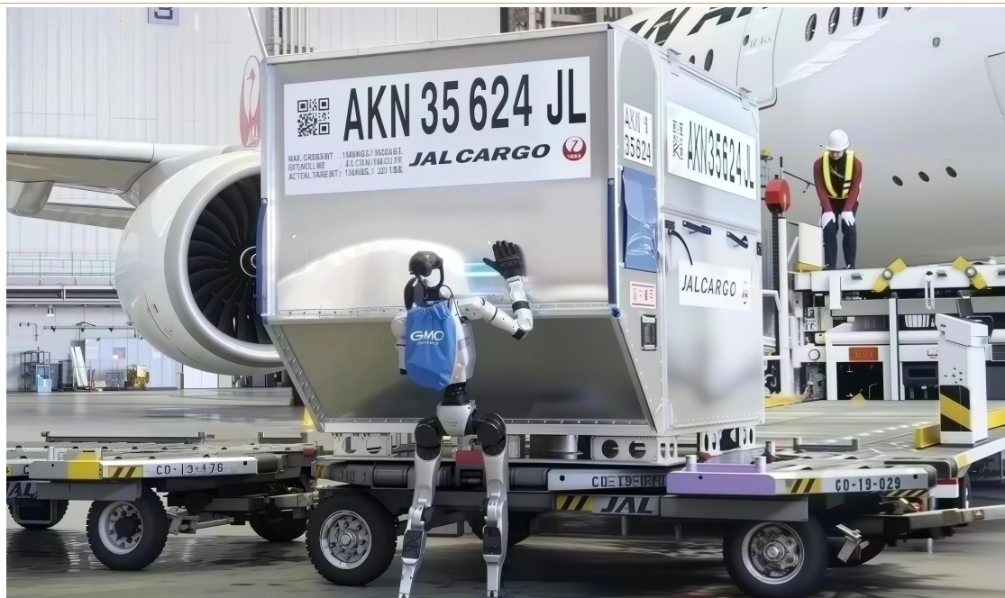
图表 3：东京羽田机场引入宇树 G1 机器人进行地勤应用实验

的，都是行李推送、货物转运等基础、重复、高强度的工作；复杂场景、特殊情况仍需人工处理。同时，也为全球应对老龄化劳动力短缺提供了新方案——当人口红利消退，人形机器人可作为“劳动力补充”，承接重体力、重复性工作，维持社会正常运转。