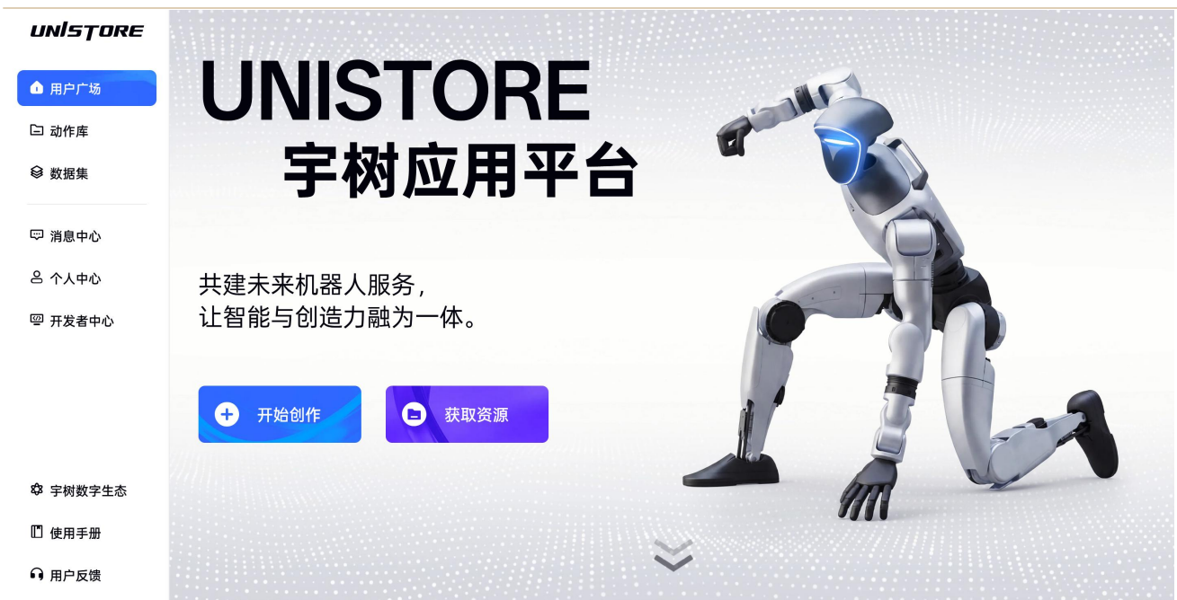
图表 4: UniStore (宇树应用平台) 官网界面

UniStore 大幅降低了机器人的使用与开发门槛。对普通用户而言，操作门槛几乎为零——无需底层编程知识，只需通过宇树 G1 APP（版本 \geq 1.9.0 ）连接机器人，从云端一键点击即可完成动作下载与部署，机器人的 OTA 版本也需不低于 1.4.8。对开发者而言，宇树提供了标准化的 SDK 和模拟环境。开发者只需通过 VR/动捕设备“演示”一遍动作，或编写简单脚本，即可生成一个可上架的“任务包”。宇树还设有收益分成机制以鼓励开发者参与生态共创，开发者上传技能通过审核后可获得 70% 的收入分成，类似 App Store 早期政策。从商业逻辑来看，UniStore 的价值不仅在于功能扩展本身，更在于构建“硬件放量 \rightarrow 生态繁荣 \rightarrow 硬件进一步放量”的正向循环。开放前一周，宇树刚发布起售价 2.69 万元的 R1 系列双臂机器人，凭借低价策略进一步扩大硬件装机量，为生态普及铺路。