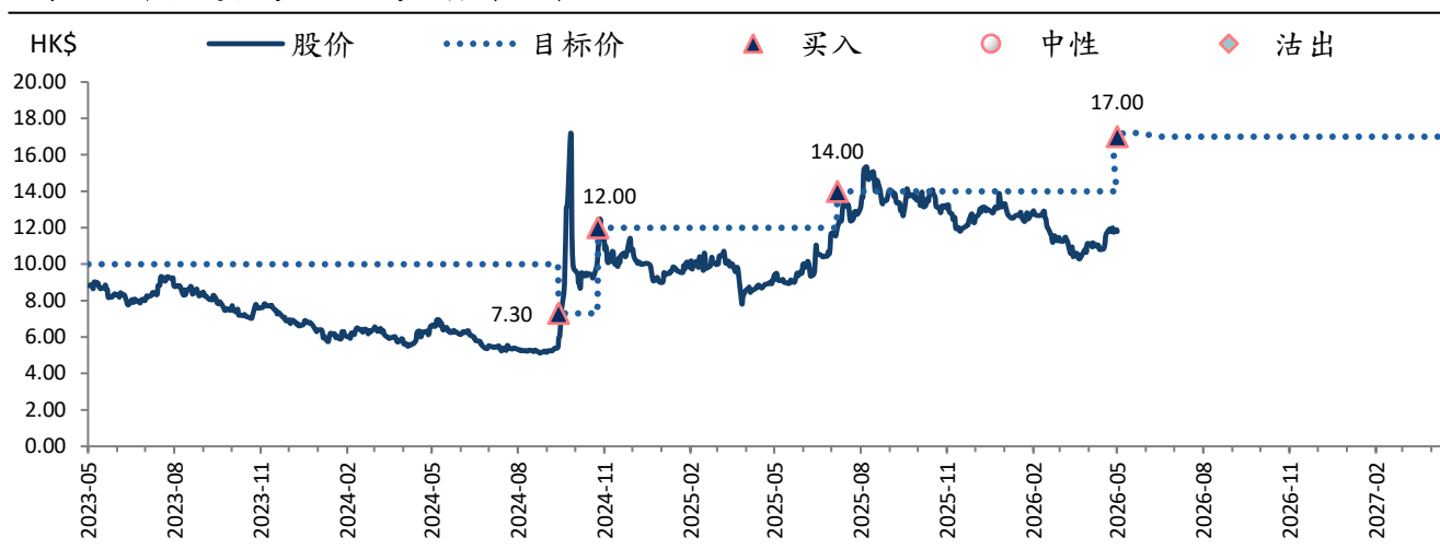
图表 2：中信建投 (6066 HK) 目标价及评级