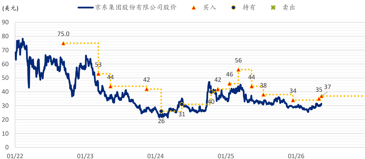
图表 3：浦银国际目标价：京东（JD.US）