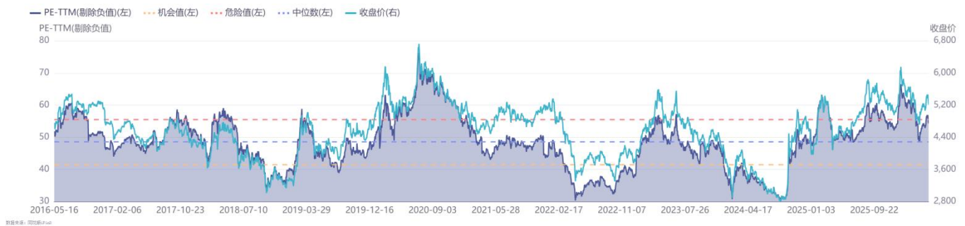
图 2：申万计算机板块近 10 年 PE TTM（单位：倍）（截至 2026 年 5 月 15 日）

截至 2026 年 5 月 15 日，根据同花顺数据，SW 计算机板块 PE TTM（剔除负值）为 54.26 倍，处于近 5 年 84.78%分位、近 10 年 75.36%分位。