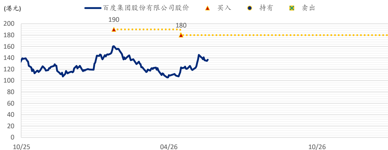
图表 3：浦银国际目标价：百度 (9888.HK)

注：截至 2026 年 5 月 19 日收盘