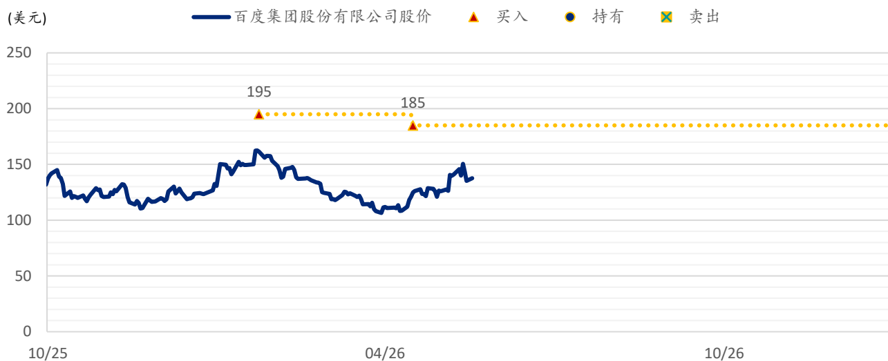
图表 2：浦银国际目标价：百度 (BIDU.US)

注：截至 2026 年 5 月 18 日收盘