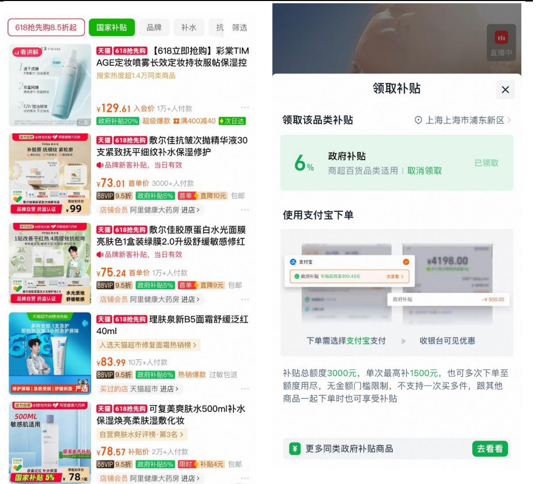
图2：天猫 618 平台/地方补贴显示

补贴覆盖范围的持续扩大，有效降低消费者实际支付价格，拉动高客单价产品转化率，头部品牌在流量获取、销量转化及品牌势能提升方面均明显受益。补贴叠加平台立减后，消费者购物意愿显著提升。