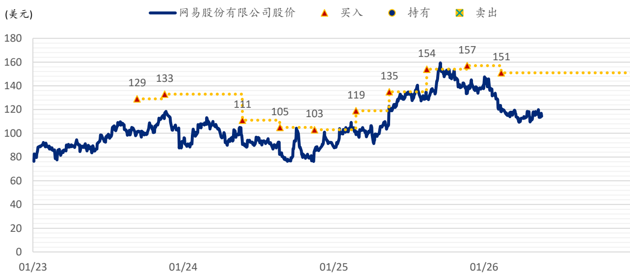
图表 3：浦银国际目标价：网易（NTES.US）

注：截至 2026 年 5 月 21 日收盘