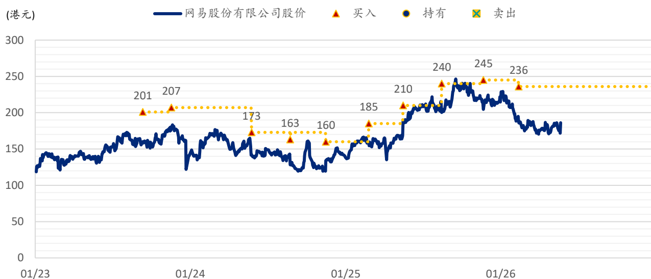
图表 2：浦银国际目标价：网易（9999.HK）

注：截至 2026 年 5 月 21 日收盘