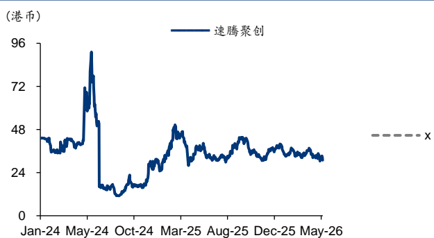
图表4: 速腾聚创 PE-Bands