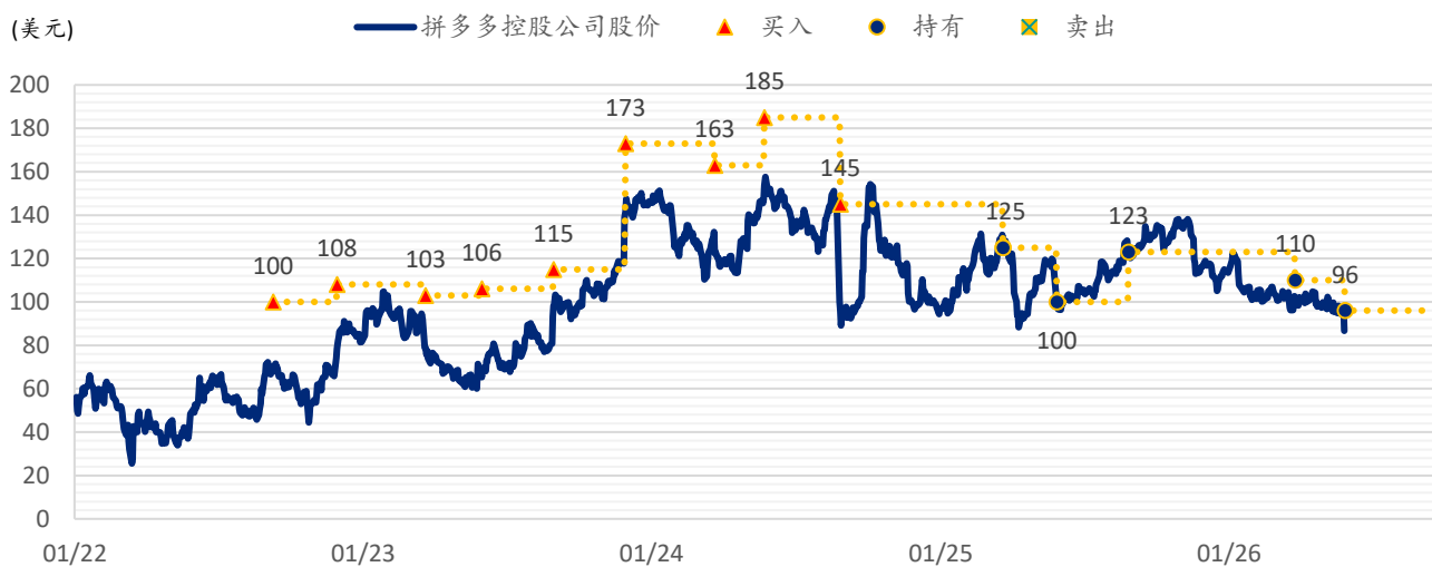
图表 2：浦银国际目标价：拼多多（PDD.US）