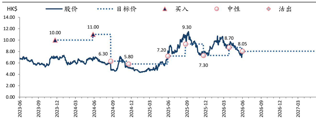
图表 2：石药集团 (1093 HK) 目标价及评级