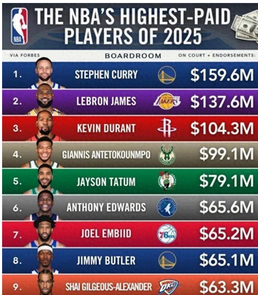
图2：福布斯全球运动员收入榜