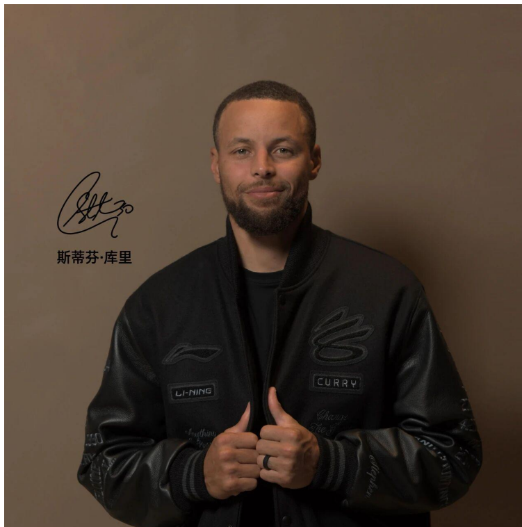
图1: 李宁品牌与库里品牌达成长期合作