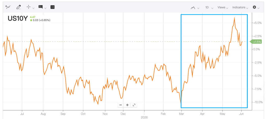
图表 5：2 月底以来 us10y 上行