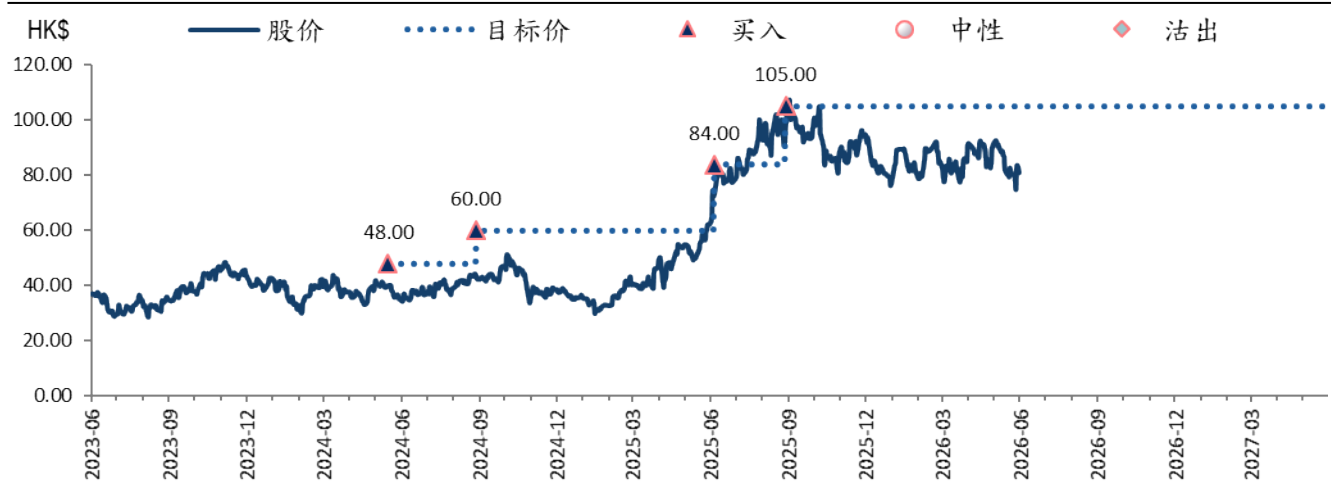
图表 1：信达生物 (1801 HK) 目标价及评级