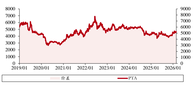
图表 7. PTA 价格、价差（单位：元/吨）