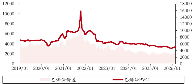
图表 4. 乙烯法 PVC 价格、价差（单位：元/吨）