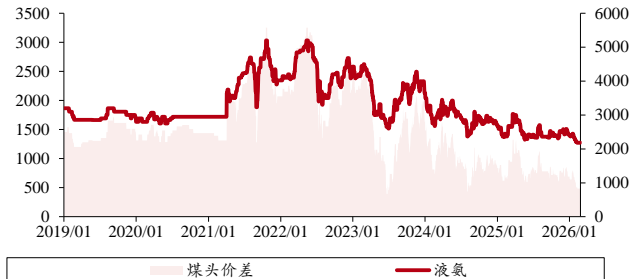
图表 5. 液氨价格、价差（单位：元/吨）