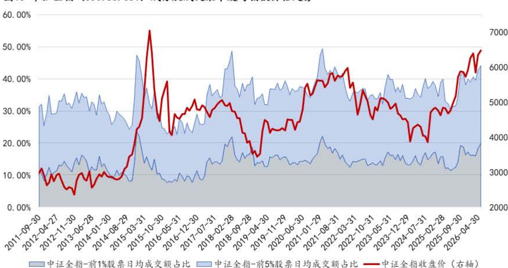
图1：中证全指（000985.CSI）成分股成交集中度与指数价格走势