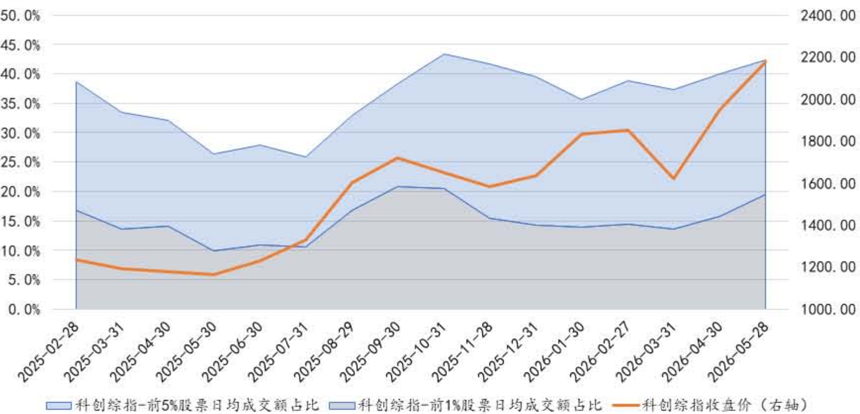
附2：科创综指（000680.SH）成分股成交集中度与指数价格走势