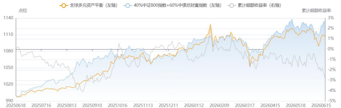
图 5：全球宏观多资产配置组合表现

【全球宏观多资产模型】截至 6 月 18 日，近 1 年内的收益率为 10.65%，基准（40%中证 800 指数+60%中债总财富指数）收益率为 13.43%。近 1 年内的夏普比率为 1.37，基准的夏普比率 1.82。