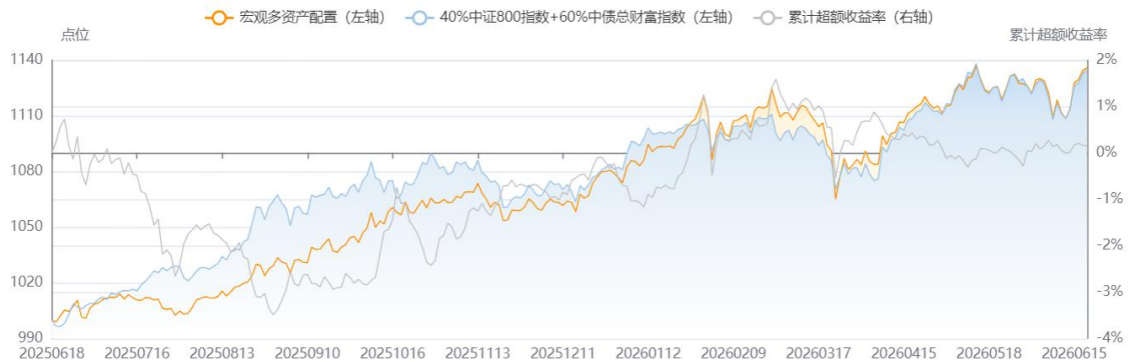
图 4：国内宏观多资产配置组合表现