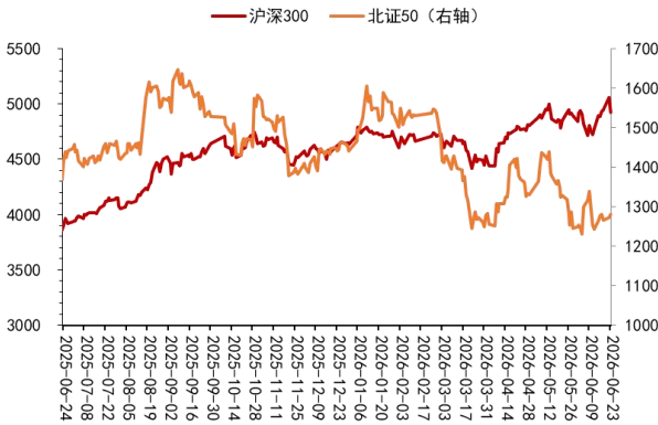
图 1：北证 50 对比沪深 300 的表现

6月23日市场基准指数温和上行，显示市场整体运行平稳。从涨跌家数看，市场呈现明显的“涨多跌少”格局。上涨家数达215家，下跌家数为96家，上涨家数远超下跌家数，市场做多氛围占据主导。成交额前十个股的成交额合计超过73亿元，显示市场核心标的交投活跃，量能集中于头部公司。