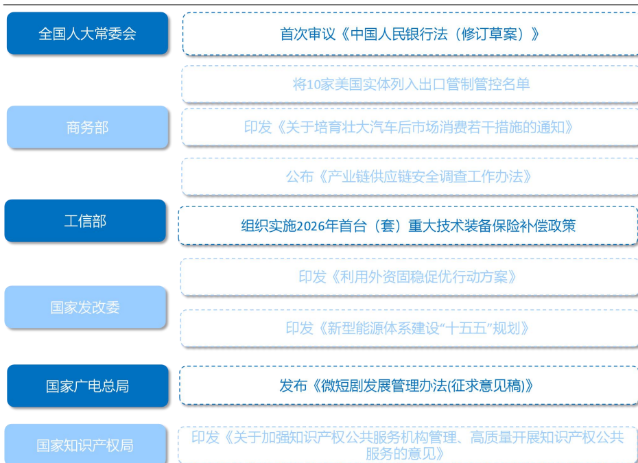
图1：国内重要政策/事件一览