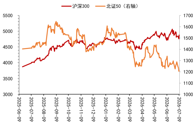
图 1：北证 50 对比沪深 300 的表现

北证 50 指数小幅收涨，表现相对平稳。市场情绪偏向谨慎，下跌家数显著多于上涨家数，显示出一定的调整压力。尽管指数收红，但市场缺乏明确的赚钱效应，个股最高涨幅未能触及涨停板，表明多头力量相对分散，未能形成合力推动个股封板。