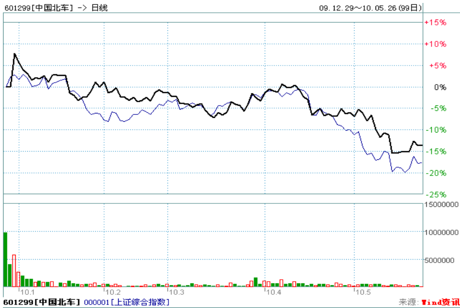
图 3: 公司股票股价相对于上海综合指数表现图

目前 A 股市场的市场情况以及对公司未来业绩的分析与预测，我们给予公司“推荐”评级。