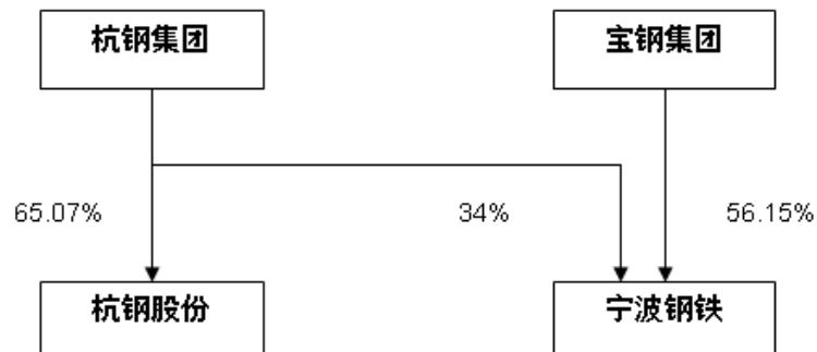
图 3、宁波钢铁股权结构

宝钢集团计划 2010 年产能达到 8000 万吨，前期控股宁波钢铁已将触角伸向浙江，未来并购杭钢的预期仍在，但考虑目前跨省重组地方阻力较大，因此重组没有时间表，但考虑到钢铁行业并不是浙江支柱行业，相对阻力要小，取得突破的可能性较其他省份要大。