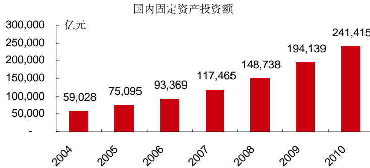
图表 1 国内固定资产投资额快速累积

渤海租赁的主营业务主要聚焦于基础设施租赁细分市场上，国内庞大的基础设施存量及地方政府强烈的融资冲动为该业务创造了厚实的市场基础。