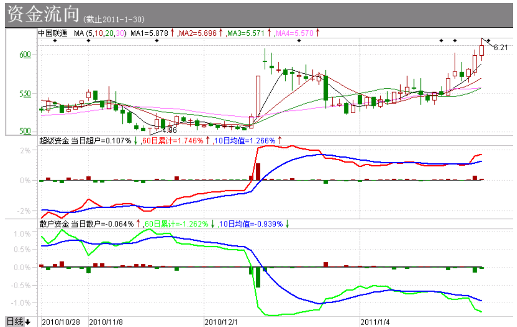
附图：相关上市公司近期资金流向

注： 超级资金(>50万股或100万元)：体现了超大户或者机构当日的净买卖方向； 散户资金(<1万股或5万元)：体现了散户当日的净买卖方向； 当日净量：红柱为净买入，绿柱为净卖出，数值为当日净量占流通盘的百分比； 60日累计：当日净量的60日累计值； 10日均值：60日累计线的10日平滑。